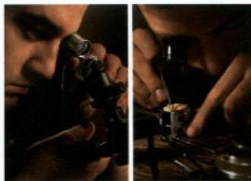
バックス & ストラウスでは、ダイヤモンドを美しく見せるための時計製作にもこだわる。その2つの製造は同等の価値と考えている。

う。光の反射、分散が計算され完全なる対称にカットされたダイヤモンドは、「アイデアルカット」(理想のカット)と呼ばれ、光が上面からは8つの矢に、下面からは8つのハートに輝く。すべての腕時計にセットインクされるダイヤモンドに、このカットが施されているのだ。