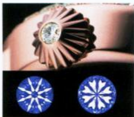
こちらがアイデアル カットの「ハート&アロー」。上側のクラウン面から8本の矢が、底部のパビリオンから8本のハートが完璧に輝く。ケースのみならずリュースにもセットされる。

う。光の反射、分散が計算され完全なる対称にカットされたダイヤモンドは、「アイデアルカット」(理想のカット)と呼ばれ、光が上面からは8つの矢に、下面からは8つのハートに輝く。すべての腕時計にセットインクされるダイヤモンドに、このカットが施されているのだ。