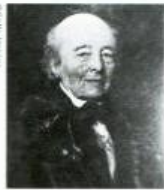
ジョン・ナッシュ

1752年生まれ。19世紀初頭に活躍した英国人建築家。王室から都市計画、設計を請け負い、ロンドンの都市整備において名を残す。